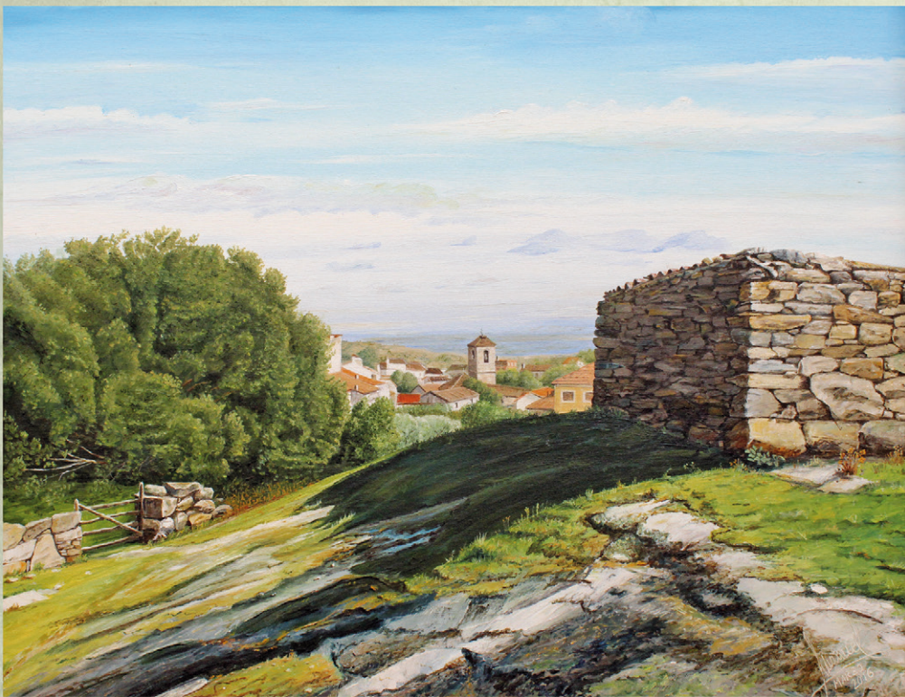
11 Desde El Corilejo Marzo 2016. 65x50 cm Dejeando por la zona, me sorprendieron estas vistas del pueblo.