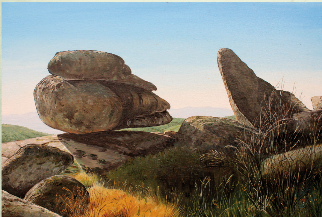
17 Figura de piedra Septiembre 2014. 55x38 cm Hay infinidad de piedras con formas curiosas en la sierra, solo hay que buscar con tranquilidad.