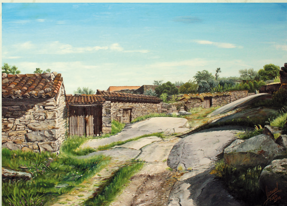
12 El Corilejo Julio 2015. 65x46 cm Todavía hoy podemos ver algunos de los pajares donde se guardaba el ganado.