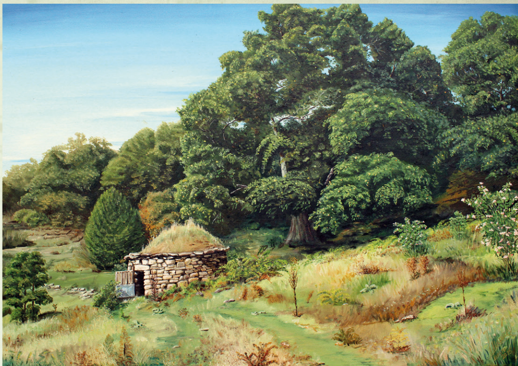
16 Castaño de tío Guache Agosto 2015. 70x50 cm Se necesitan más de tres personas para abrazar el troco de este y otros antiguos castaños de Los Chapatales.